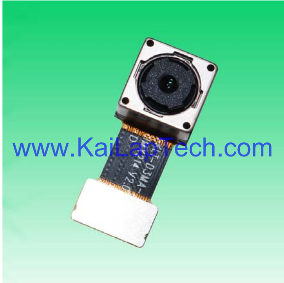
Ansicht von oben